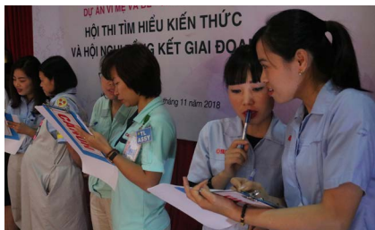
Trong hội thi tìm hiểu kiến thức, các đội chơi tranh tài qua hình thức hùng biện, trả lời 7 câu hỏi về chủ đề chăm sóc SKSS, dinh dưỡng và sức khỏe tinh thần cho phụ nữ trong độ tuổi sinh sản.