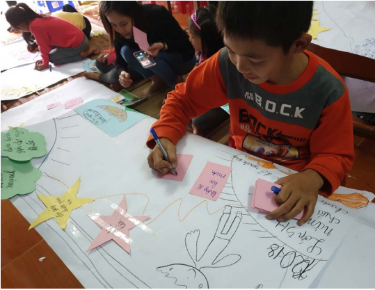
Trần Văn Việt (11 tuổi) trình bày con đường mơ ước của mình.