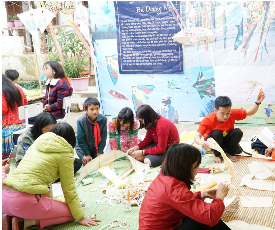
Các gian làng nghề dân gian được thiết kế để giới thiệu đến các em học sinh gồm có: Tranh dân gian Đông Hồ, Diều gió làng Bá Dương Nội, Chuẩn chuẩn tre làng Thạch Xá, Tò he làng Xuân La, Nón lá làng Chuông...

Sự kiện này nằm trong chương trình triển khai dự án "Sách cho em" tại huyện Mèo Vạc với mục đích giúp các em học sinh mở mang kiến thức, phát triển tư duy và năng lực học tập. Tại ngày hội, ban tổ chức và các đơn vị tài trợ dự án "Sách cho em" đã trao tặng 12.600 cuốn sách cho 33 trường tiểu học và THCS tại huyện Mèo Vạc. Trong suốt năm học 2018-2019, dự án sẽ tiếp tục tập huấn cho các giáo viên, trang bị tủ sách và đưa tiết đọc sách đến từng lớp học, giúp trẻ nuôi dưỡng tâm hồn, vun đắp trí tuệ, chấp cánh ước mơ.