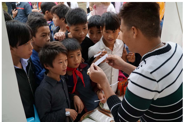
Gian ẩm thực mang đến cho các em học sinh những câu hỏi tìm hiểu về cách làm ra các món quà đặc sản như chè lam, bánh đậu xanh Hải Dương, bánh chả Hà Nội, kẹo dừa Bến Tre, kẹo lạc Siu Châu...