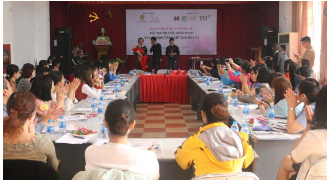
Tiểu phẩm “Căn bệnh nguy hiểm” về chủ đề trầm cảm sau sinh được thể hiện thành công và xúc động với diễn xuất của đội kịch đến từ Công ty Yamaha Motor Việt Nam.

khỏe sinh sản và sức khỏe tinh thần cho NLĐ trong độ tuổi sinh sản chính là tiền đề đảm bảo tầm vóc cho các thế hệ trẻ trong tương lai. Thành quả đã đạt được trong hai giai đoạn vừa qua của dự án ‘Vì mẹ và bé - Vì tầm vóc Việt’ là tiền đề và động lực để đơn vị triển khai tiếp tục mở rộng địa bàn dự án đến nhiều người hưởng lợi hơn nữa trong thời gian sắp tới.”