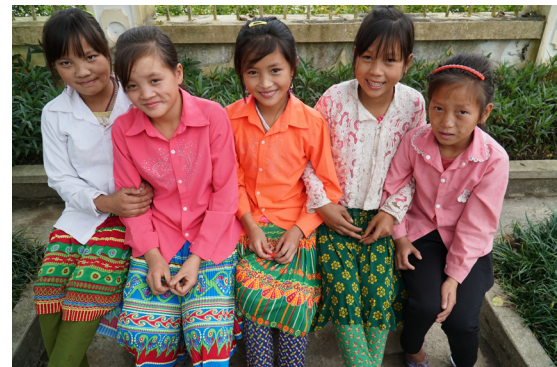
Ảnh trang bìa: Các em học sinh trường Dân tộc nội trú THCS Cán Chu Phìn (huyện Mèo Vạc, tỉnh Hà Giang) - nơi sẽ diễn ra sự kiện “Ngày hội vui cùng làng nghề” vào tháng 10/2018. Đây là một trong các hoạt động thuộc dự án “Sách cho em” do Dự án Sách cho em, Quỹ Vì Tầm Vóc Việt và các đối tác khác phối hợp tổ chức.