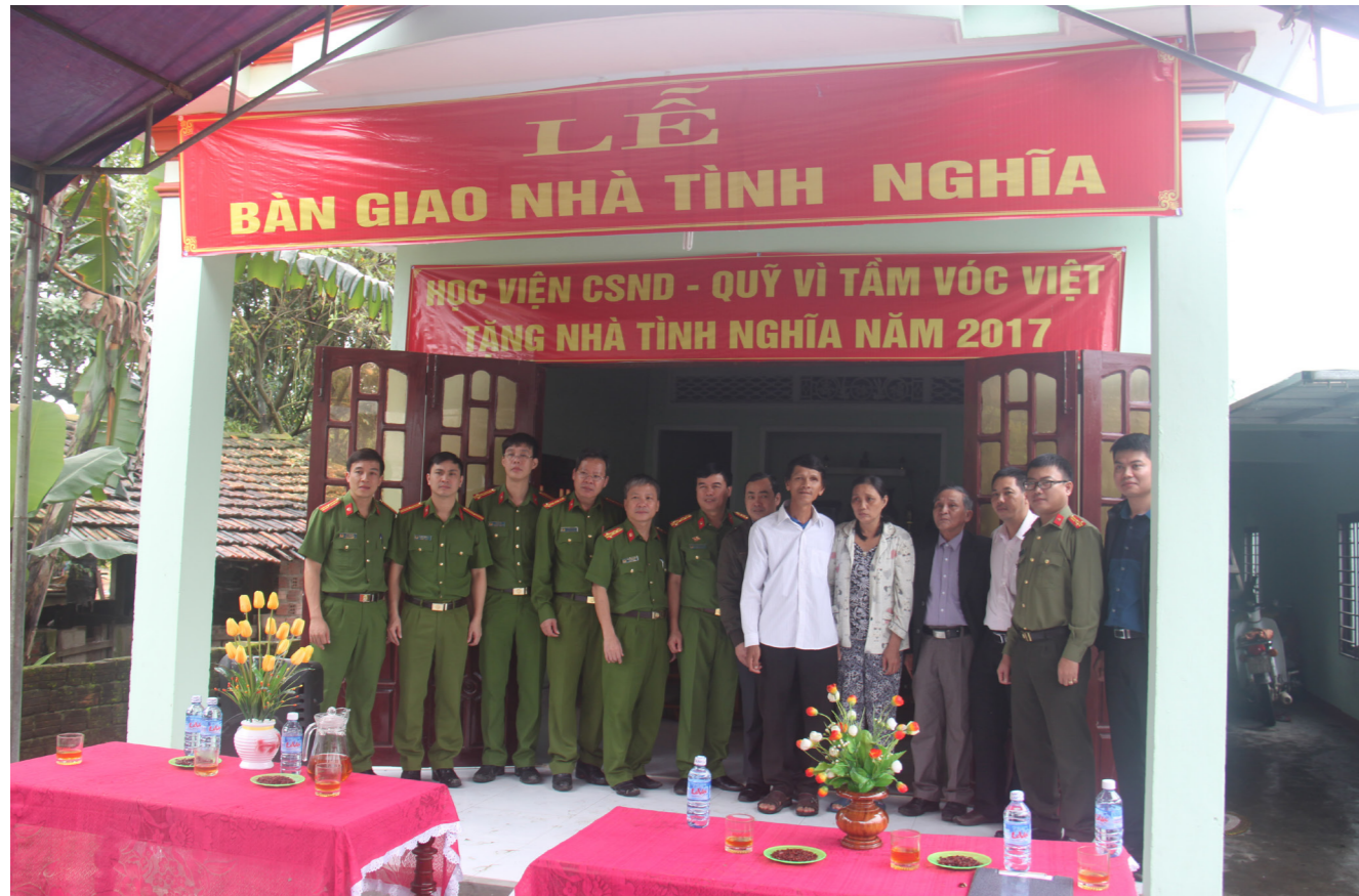
Đại diện Quỹ Vì Tâm Vóc Việt (đứng bên phải ảnh) cùng đoàn công tác Học viện Cảnh sát Nhân dân chụp ảnh lưu niệm tại Lễ bàn giao nhà tình nghĩa

Sau hơn năm tháng tập trung xây dựng, năm căn nhà đã hoàn thiện và được các hộ dân đưa vào sử dụng. Đây không chỉ là niềm vui của các hộ hưởng lợi mà còn là niềm vui chung của cán bộ và nhân dân địa phương.