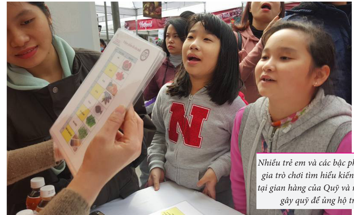
Nhiều trẻ em và các bậc phụ huynh đã tham gia trò chơi tìm hiểu kiến thức dinh dưỡng tại gian hàng của Quý và mua các sản phẩm gây quỹ để ủng hộ trẻ em nghèo.

Trong 3 ngày từ 02 đến 04 tháng 02 năm 2018, tại Ecopark, Quý Vì Tâm Vóc Việt có gian hàng tham gia tại Hội chợ Tết Tinh hoa 3 miền.