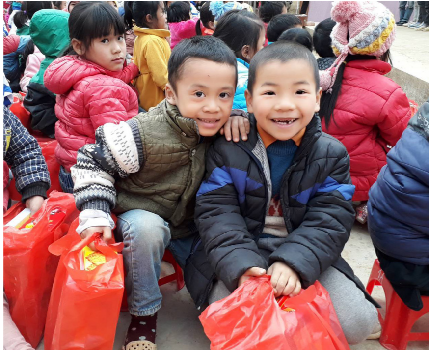
Niềm vui của các em được nhận lên gấp bội khi được nhận quà Tết ấm áp tình người

Lãnh đạo xã Mường Bang cho biết hoạt động hỗ trợ này có ý nghĩa lớn về mặt tinh thần và vô cùng thiết thực đối với các hộ nghèo và học sinh trong xã.