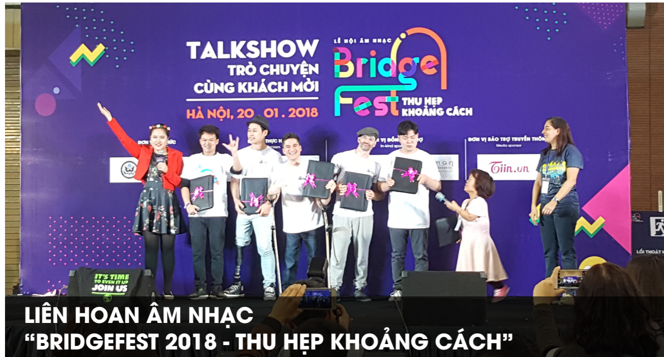
LIÊN HOAN ÂM NHẠC “BRIDGEFEST 2018 - THU HẸP KHOẢNG CÁCH”

T háng 1 năm 2018, Quý tham dự sự kiện liên hoan âm nhạc “BridgeFest 2018 – Thu hẹp khoảng cách” – được tổ chức bởi Oxfam và Đại Sứ Quán Mỹ. Hoạt động này là một phần của chiến dịch toàn cầu “Even it Up” với mục tiêu nâng cao nhận thức và kêu gọi hành động từ các bên tham gia và đặc biệt là giới trẻ trong việc giảm định kiến và sự bất bình đẳng. Tại sự kiện, Quý đã chia sẻ về những chương trình và hoạt động nhằm tăng cường cơ hội tiếp cận bình đẳng của người nghèo và những trẻ em có hoàn cảnh khó khăn với các dịch vụ y tế và giáo dục. Những câu chuyện bình dị và giàu ý nghĩa này đã thu hút được sự quan tâm và ủng hộ của rất nhiều khách mời.