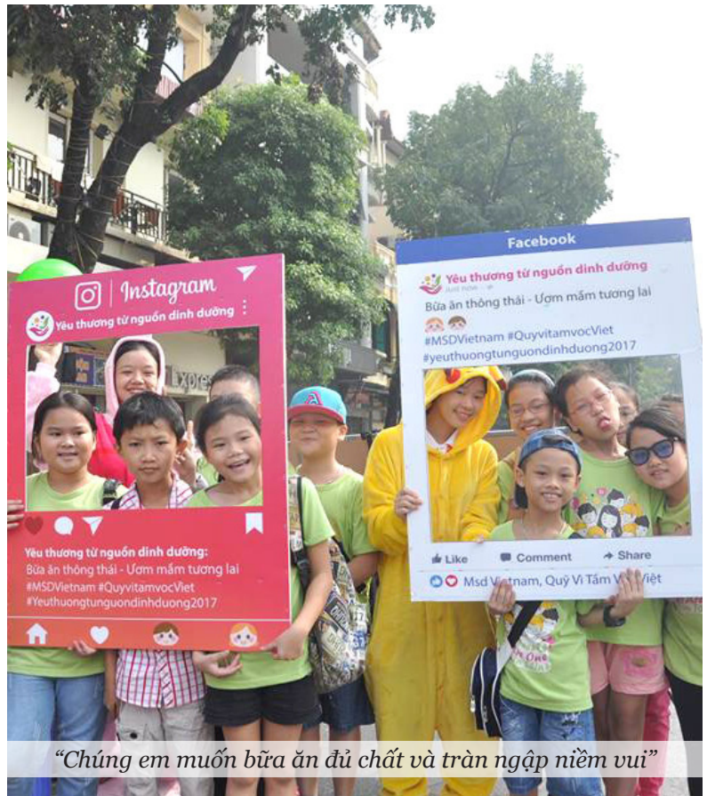
“Chúng em muốn bữa ăn đủ chất và tràn ngập niềm vui”