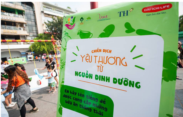
Nhiều thông điệp ý nghĩa về dinh dưỡng gửi gắm tới cộng đồng.

Hàng nghìn người đã tham gia vào các hoạt động trải nghiệm trong Chiến dịch, lan toả tiếng cười và bổ sung các kiến thức dinh dưỡng bổ ích. □