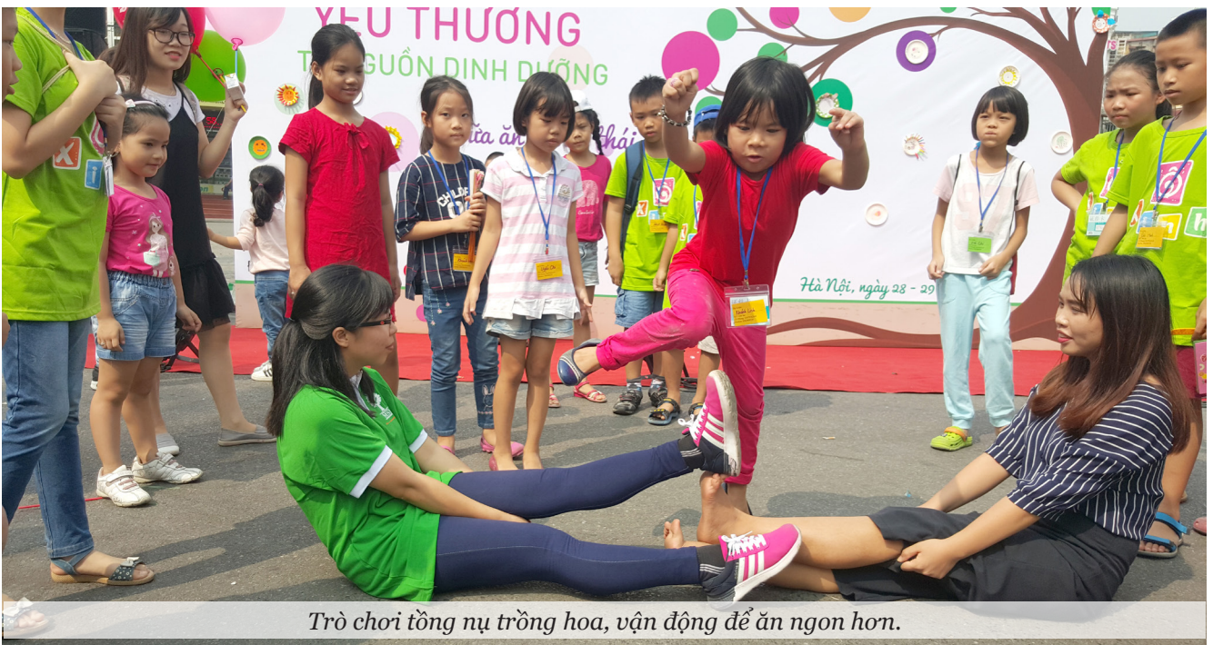
Trò chơi tồng nụ trồng hoa, vận động để ăn ngon hơn.