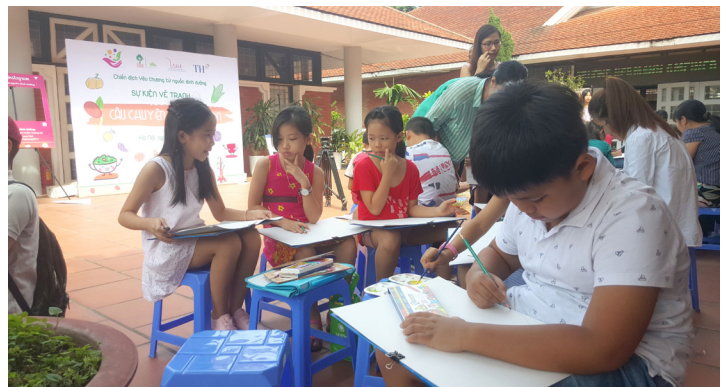
Các con vẽ những bức tranh sắc màu tại trường Hermann - Lòai thủ thi về Quyền dinh dưỡng của con.