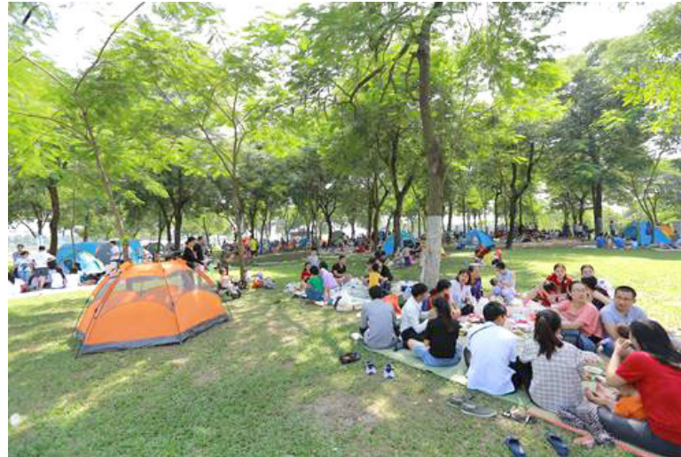
Gắn kết các cá nhân trong gia đình, tôn vinh các giá trị thật của cuộc sống, vì hạnh phúc đích thực của mọi người.