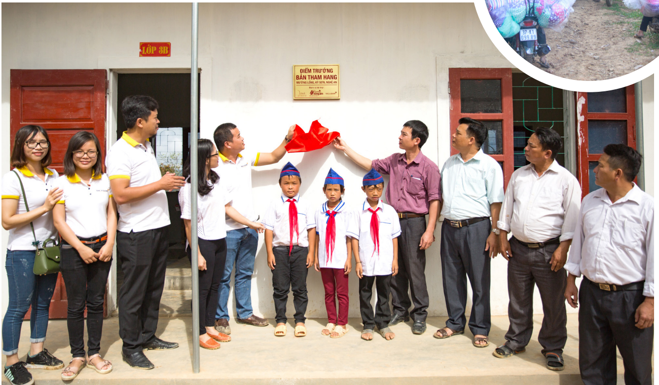
Đại diện các đơn vị chứng kiến bóc băng khánh thành Điểm trường Tham Hang.