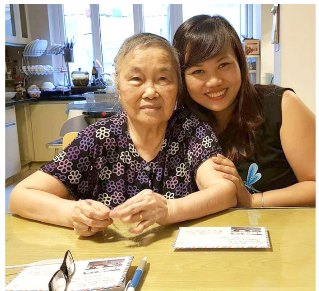
Trao đi để nhận lại nhiều yêu thương - đó là lối sống đẹp mà mỗi chúng ta luôn tâm niệm và cố gắng theo đuổi.

Quỹ Vì Tâm Vóc Việt cũng trân trọng cảm ơn sự kết nối của chị có nickname là Vui Vũ