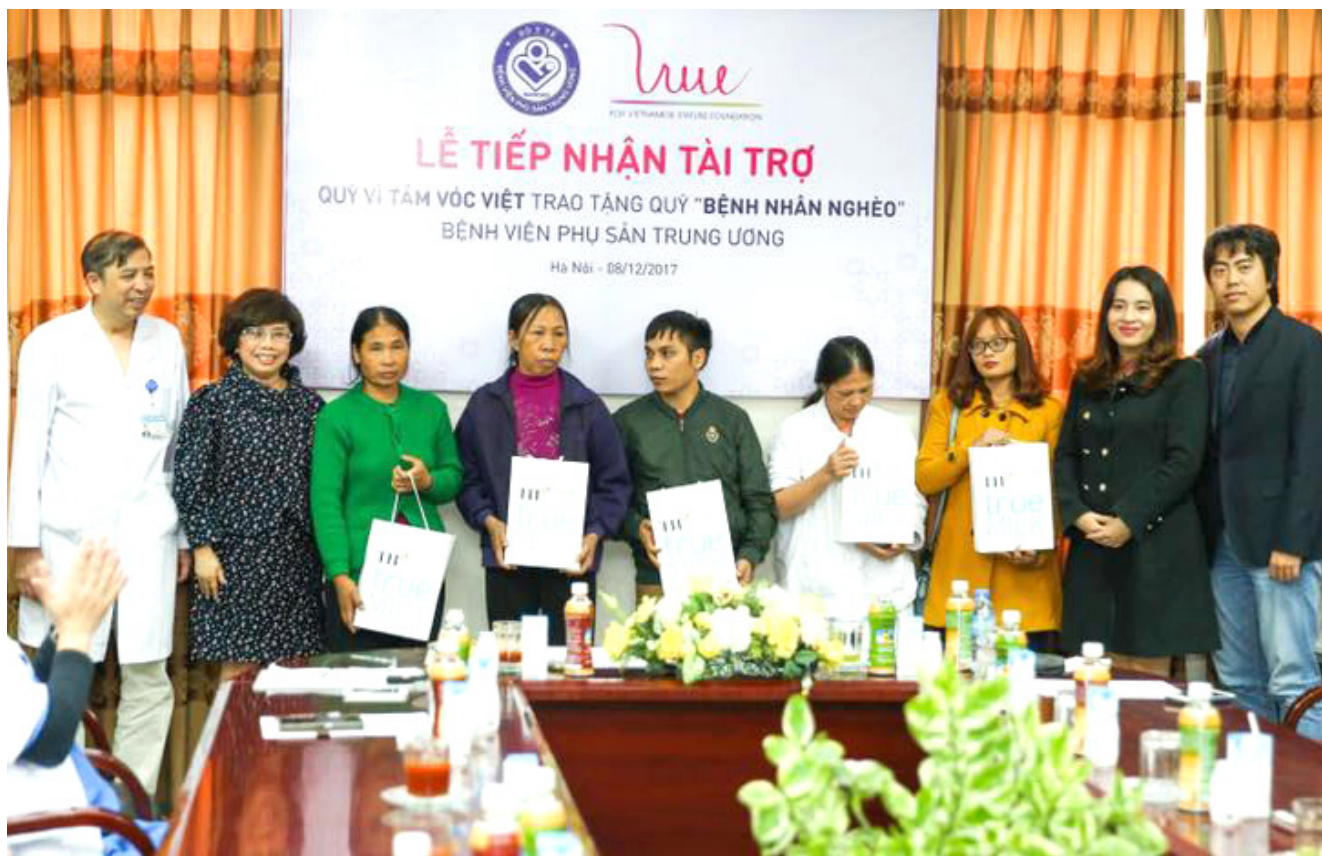
Quỹ Vì Tầm Vóc Việt tặng quà cho 5 bệnh nhân nghèo được mời chứng kiến tại Lễ tiếp nhận.