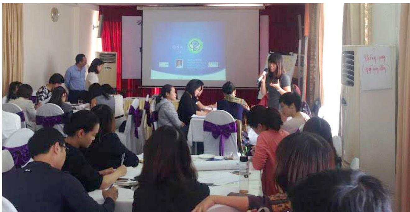
Tọa đàm nhằm khuyến khích các sáng kiến kinh doanh giải quyết các vấn đề xã hội và môi trường cấp bách