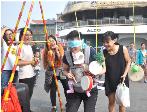
Cả nhà mình cùng vui nào!

một không gian ấm cúng, gần gũi, sáng tạo và vui nhộn thông qua các trải nghiệm kết nối gia đình như: trải nghiệm triển lãm tranh; cùng con vẽ, cắt dán; bịt mắt đập “trống thực phẩm”; ném vòng trên “Tháp dinh dưỡng”; và tham gia cuộc thi “Rung chuông vàng”. □