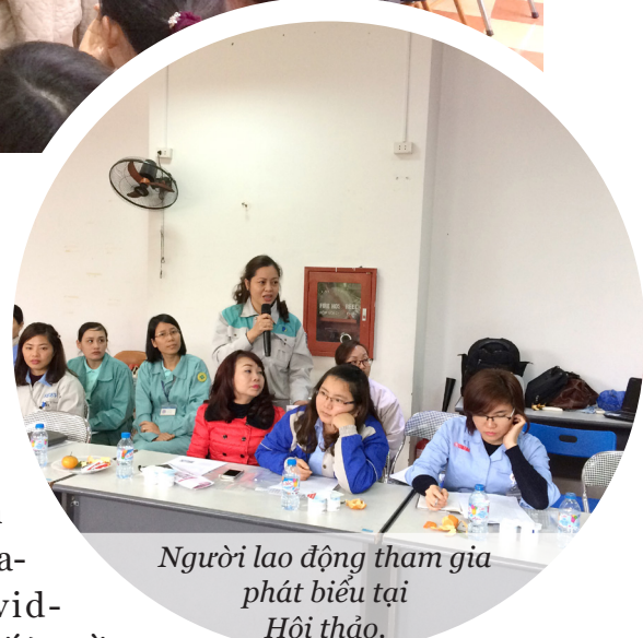
Người lao động tham gia phát biểu tại Hội thảo.

các thực hành tốt trong chăm sóc sức khỏe cho trẻ em và phụ nữ mang thai; iii) Tổ chức đợt thăm khám SKSS-TD, sức khỏe tinh thần cho người lao động v. v. Chúng tôi mong rằng thông qua những giá trị thiết thực mà dự án đem lại cho người lao động và trẻ em – thế hệ tương lai, Dự án sẽ tiếp tục nhận được sự quan tâm và chung tay, góp sức của cả cộng đồng, các doanh nghiệp, cơ quan nhà nước có thẩm quyền, các nhà tài trợ và các tổ chức phát triển. Điều đó là vô cùng quan trọng để mô hình dự án có thể được duy trì và nhân rộng tại các KCN của Hà Nội và trên cả nước”. □