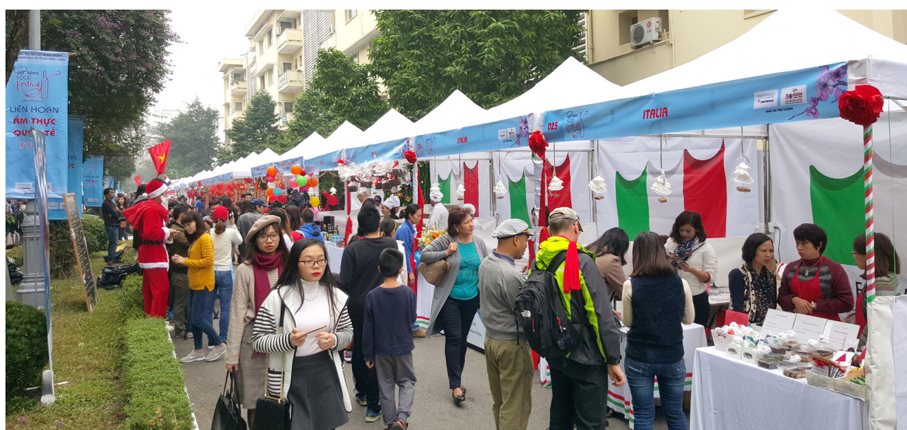
Liên hoan ẩm thực quốc tế 2017 nơi gặp gỡ giao lưu và để lại ấn tượng với các Đại sứ quán.