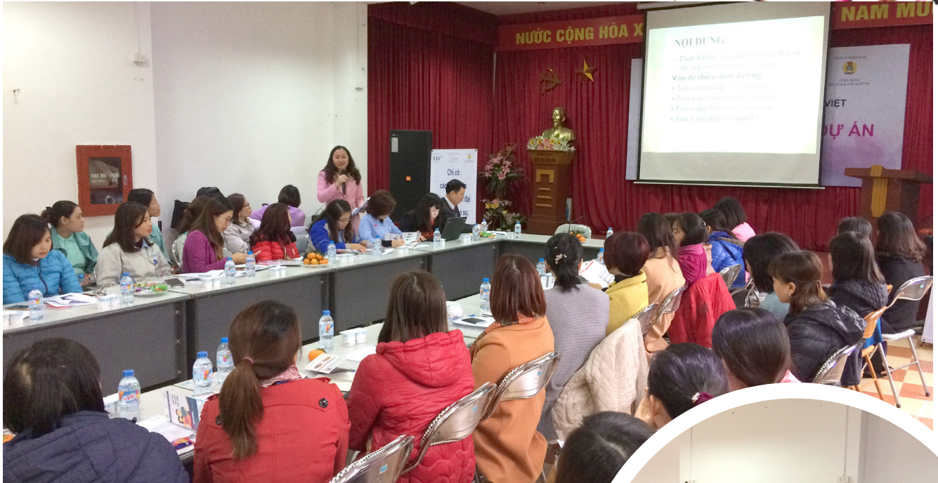
Dự án Vì mẹ và bé - Vì tâm vóc Việt được nhiều đại biểu đánh giá cao và mong muốn được tiếp tục triển khai rộng rãi.

SEI đã được hưởng lợi trực tiếp từ các hoạt động của dự án này thông qua việc tham dự các buổi truyền thông và tiếp nhận các tờ rơi/tờ gấp. Bên cạnh đó, hơn 40 cán bộ y tế và cán bộ công đoàn cơ sở của KCN Thăng Long cũng đã được tập huấn kỹ năng cung cấp thông tin về dinh dưỡng và sức khỏe cho người lao động.