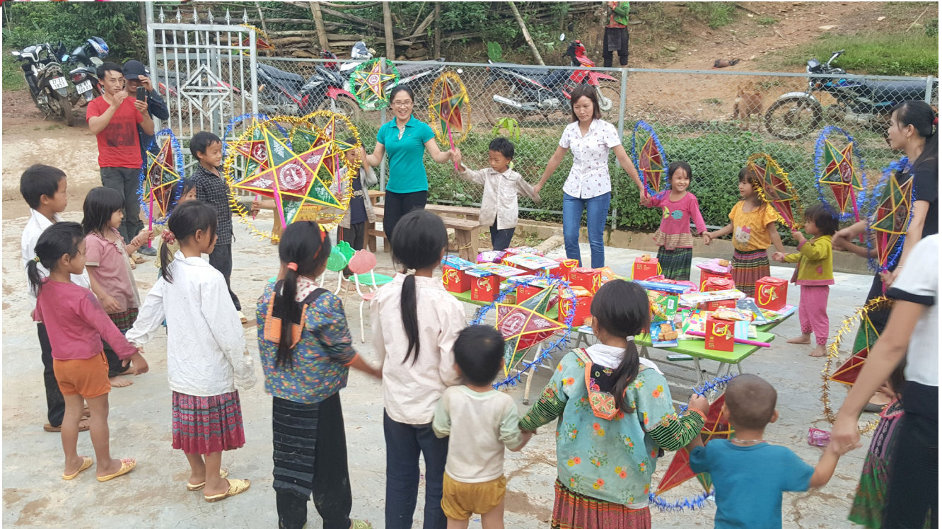
Đón năm học mới trong niềm vui của Tết độc lập và đón Tết Trung thu sớm của trẻ em Thẩm Pung.