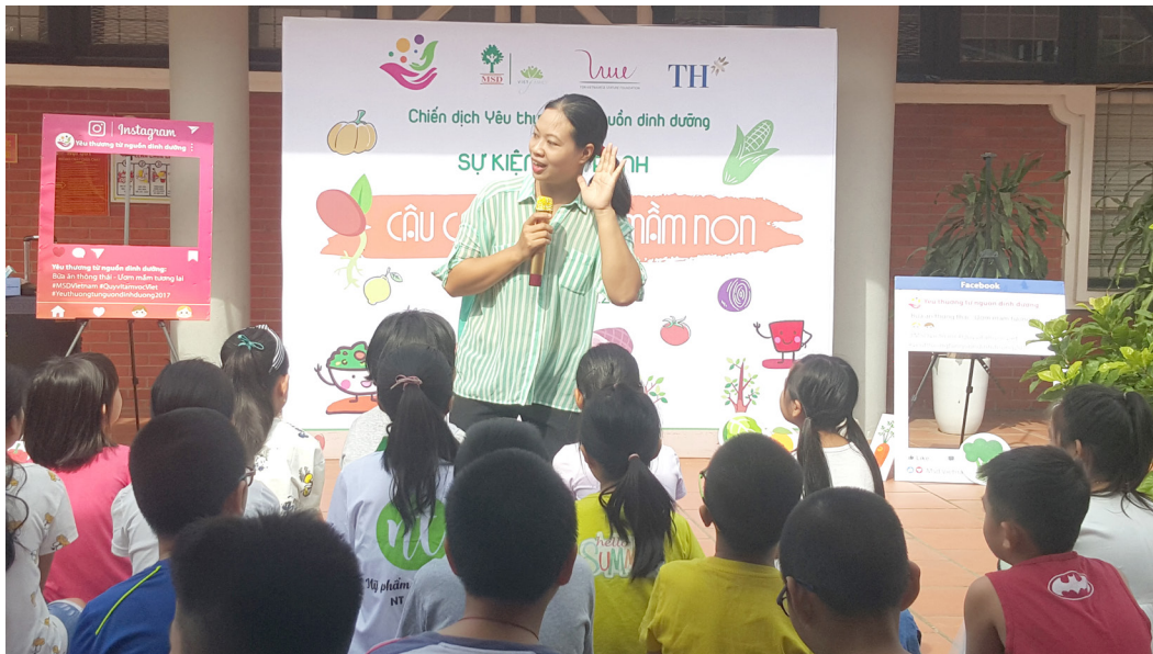
Lắng nghe trẻ em nói.

Ngày hội Yêu thương từ nguồn dinh dưỡng diễn ra ngay sau chuỗi sự kiện Cuộc thi Sáng tạo tác phẩm truyền thông “Câu chuyện của Mầm non” (đến ngày 20.10.2017); Sự kiện vẽ tranh “Câu chuyện của Mầm non” (15.10.2017), Tọa đàm dinh dưỡng “Con không muốn làm máy nghiền thức ăn” (21.10.2017) ... , là điểm nhấn cũng như là hoạt động khép lại Chiến dịch “Yêu thương từ nguồn dinh dưỡng” năm 2017.