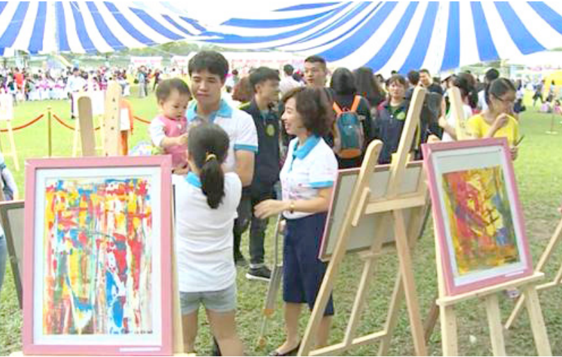
Thông điệp biết “TRÂN QUÝ” những gì mình đang có và “CHO ĐI” để hạnh phúc nhân lên gấp bội.