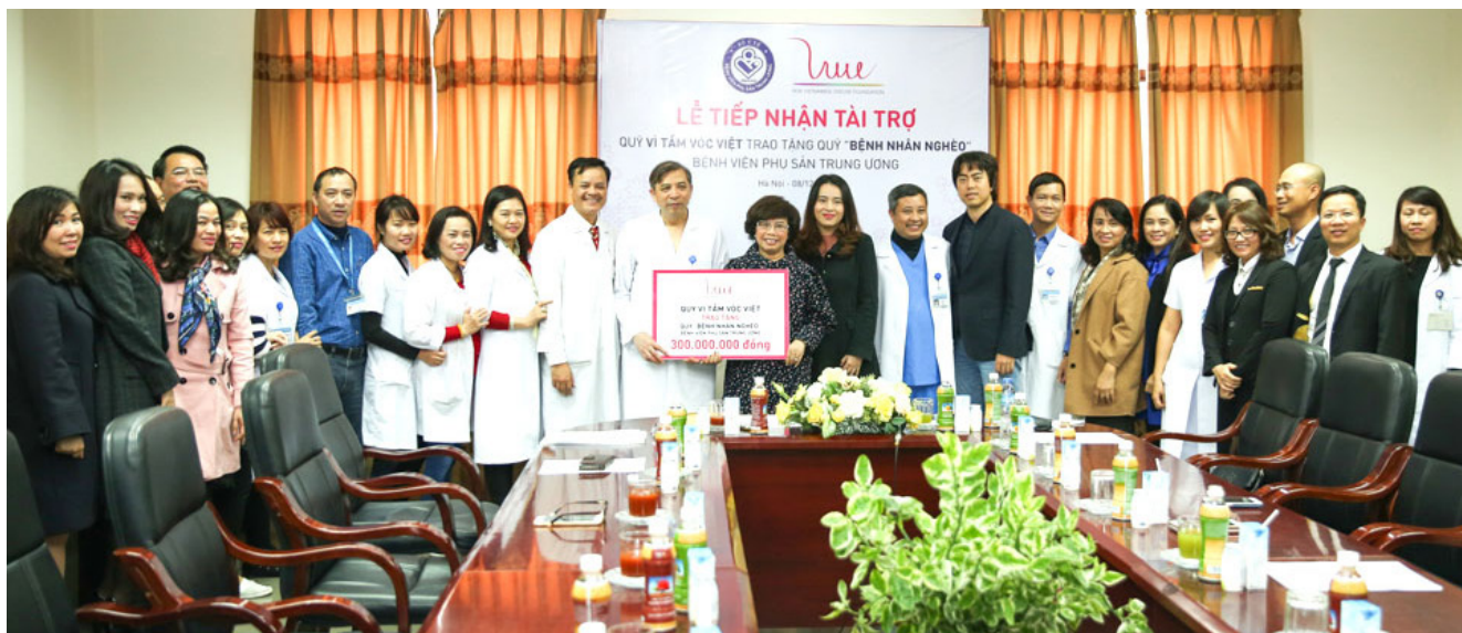
Tinh thần tương thân tương ái vì cộng đồng của Quỹ Vì Tầm Vóc Việt gắn với “Chương trình chăm sóc sức khỏe cho bà mẹ mang thai”.

chương trình hành động của Quỹ Vì Tầm Vóc Việt, đó là “Chương trình chăm sóc sức khỏe cho bà mẹ mang thai”. □