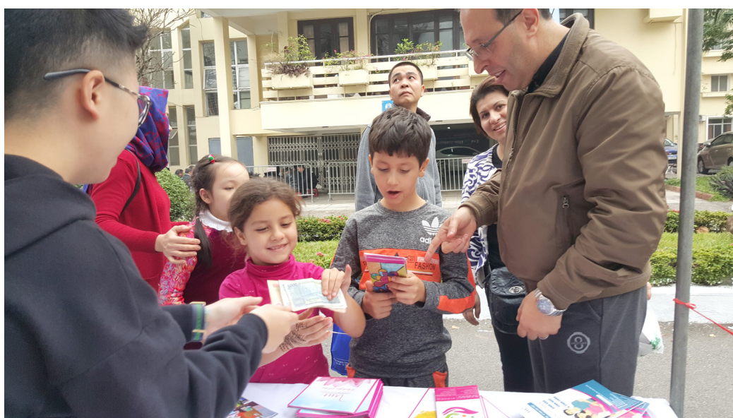
Những khách hàng nhí mua hàng gây quỹ tại gian hàng của Quỹ Vì Tầm Vóc Việt.

dự của đại diện Đại sứ quán các nước tại Việt Nam, đại diện các trung tâm văn hóa nước ngoài, các Sở ngoại vụ địa phương, các đơn vị thuộc Bộ Ngoại giao, một số doanh nghiệp và đơn vị tài trợ. Gian hàng của Quỹ đã để lại ấn tượng sâu sắc tới du khách trong và ngoài nước, đặc biệt là các Đại sứ quán tại Việt Nam. □