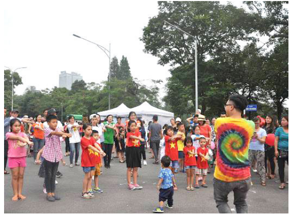
Ai bảo mình bé, mình không biết nhảy nào!!!