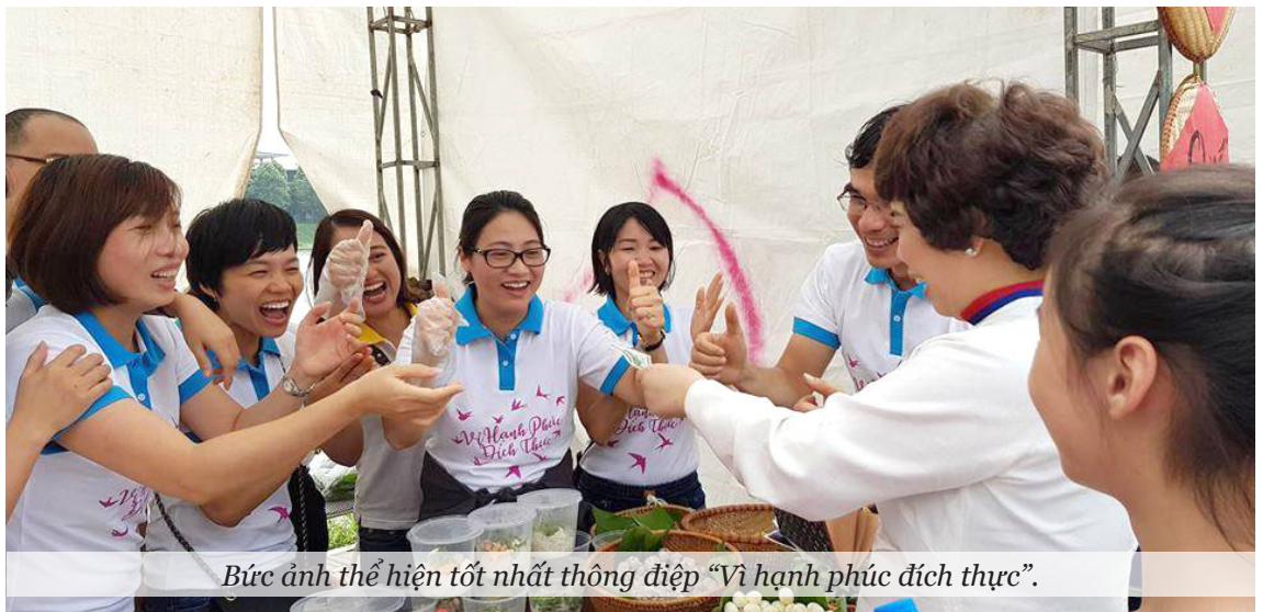
Bức ảnh thể hiện tốt nhất thông điệp “Vì hạnh phúc đích thực”.

Á Bank) với chú thích “Cho đi một nụ cười, nhận lại ngàn nụ cười trong Ngày Hạnh Phúc Đích Thực”. Đây là bức ảnh chụp khoảnh khắc tập thể CBNV của Khối Hành chính, Ban Pháp chế và Văn phòng HĐQT Ngân hàng TMCP Bắc Á đang tươi cười đón khách mua hàng tại gian hàng bán bánh canh của mình.□