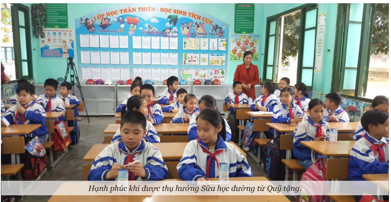
Hạnh phúc khi được thụ hưởng Sữa học đường từ Quỹ tặng.