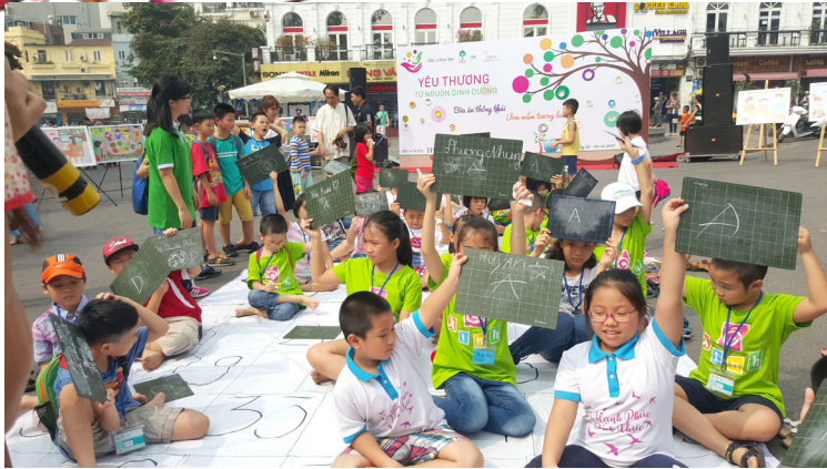
Kiến thức về dinh dưỡng được cập nhật qua phần thi “Rung chuông Vàng” tại Ngày hội.