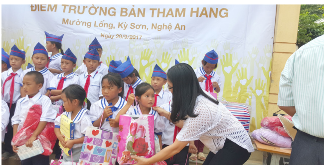
Đại diện Quỹ Vì Tâm Vóc Việt tặng quà cho các em.