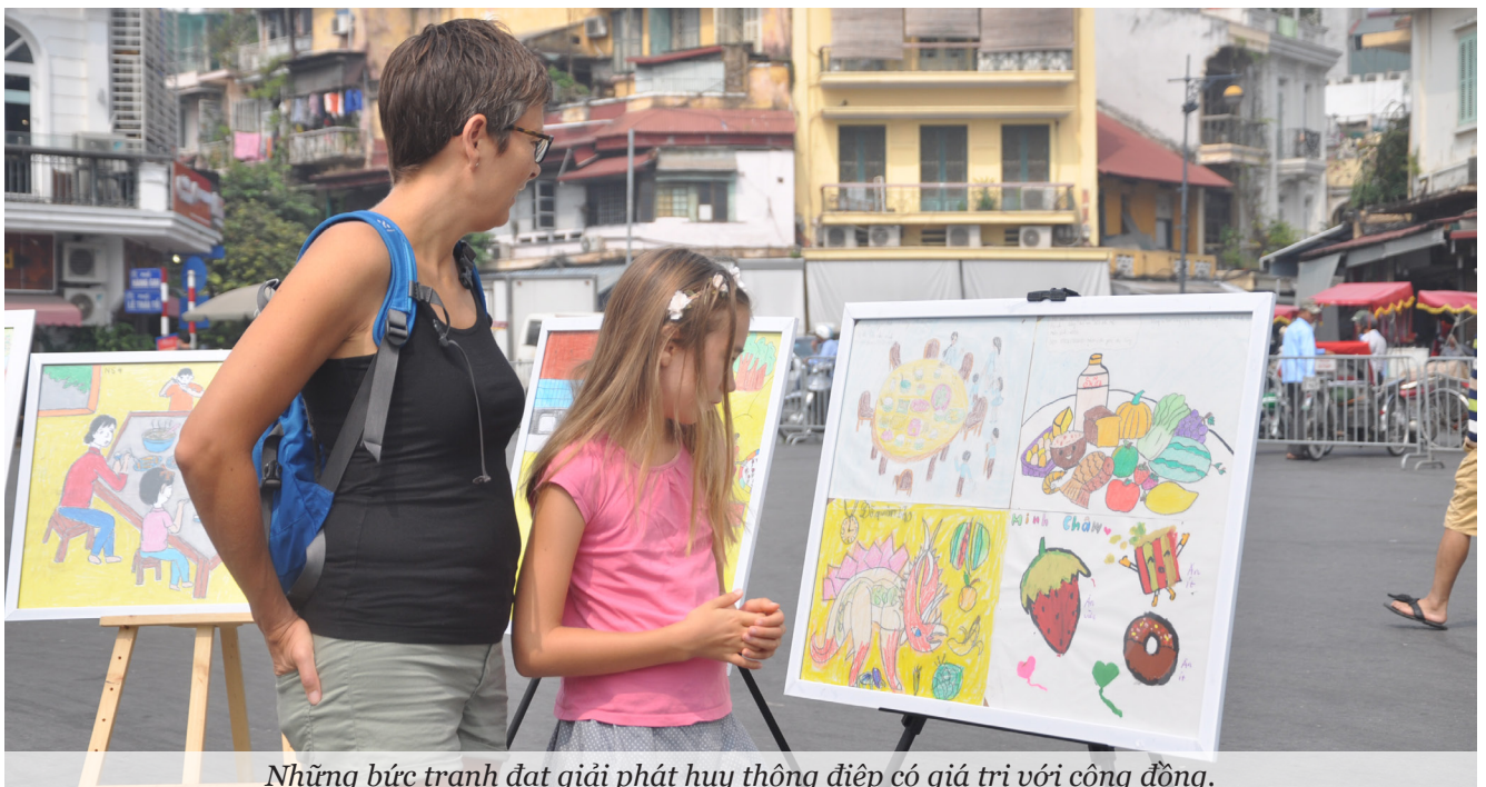
Những bức tranh đạt giải phát huy thông điệp có giá trị với cộng đồng.