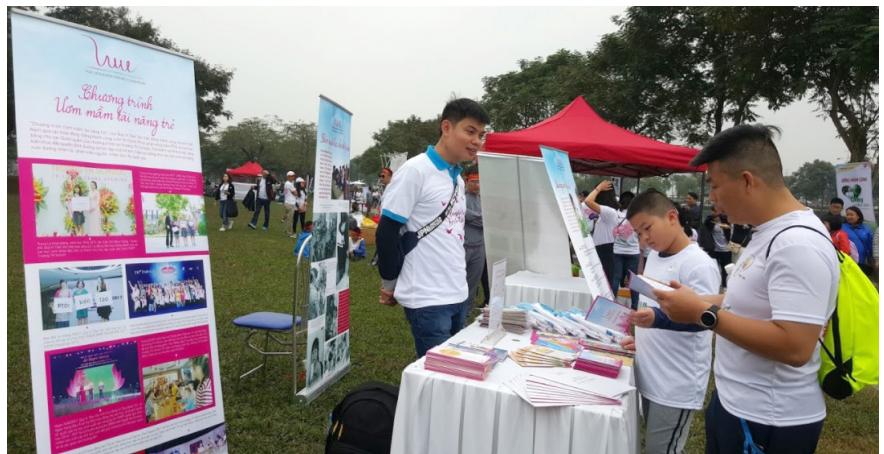
Gian hàng gây quỹ của Quỹ Vì Tâm Vóc Việt tại Ngày hội từ thiện Chạy vì trái tim.