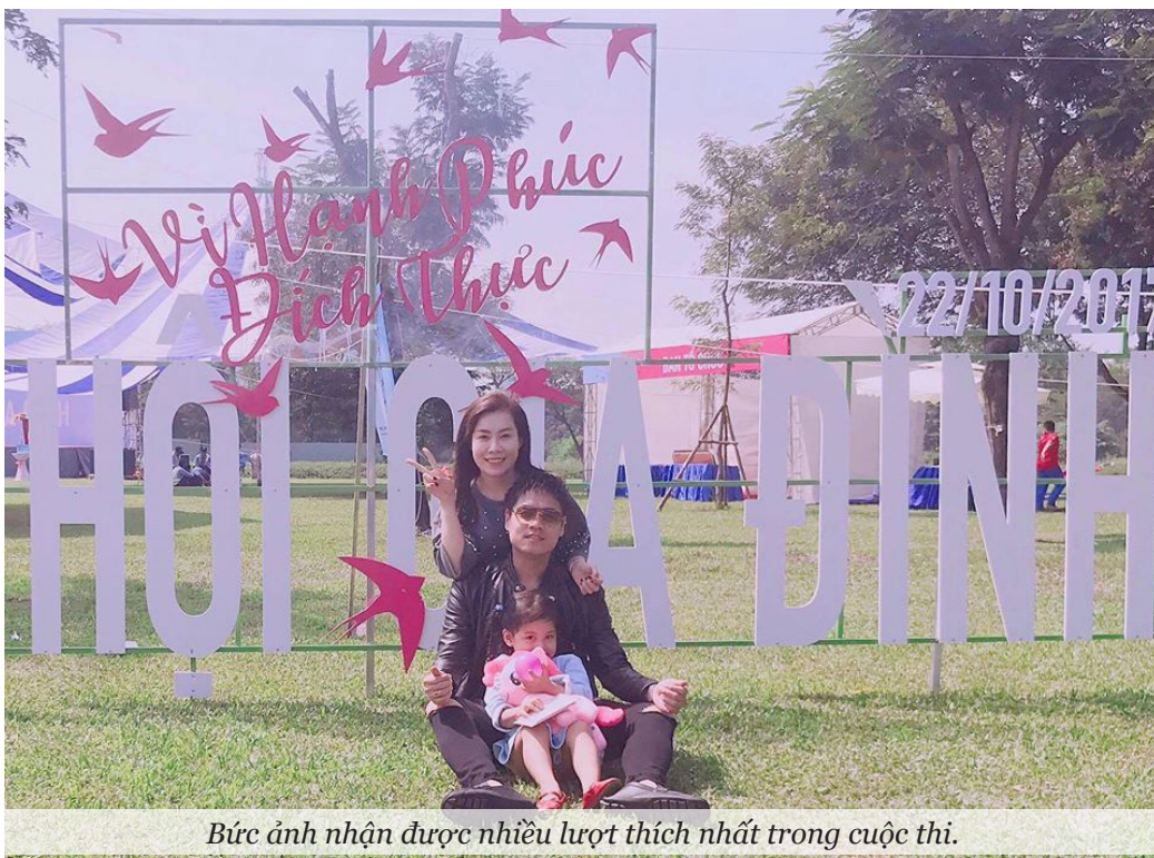
Bức ảnh nhận được nhiều lượt thích nhất trong cuộc thi.