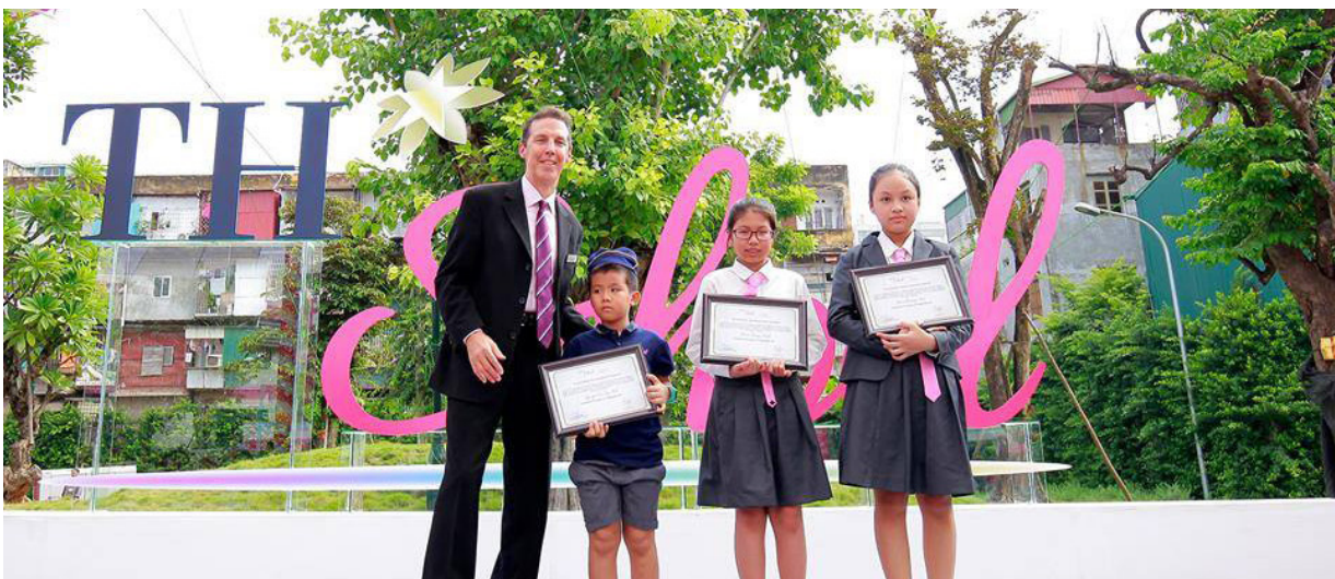
Học bổng Vì Tâm Vóc Việt trao tặng cho 3 em học sinh xuất sắc vượt qua hàng trăm thí sinh tranh tài trong kì thi giành học bổng tại TH School.

Tại buổi Khai giảng năm học 2015 – 2016 Quỹ cũng đã tài trợ 62,1 tỷ đồng tiền học bổng dành cho 45 em học sinh khóa đầu tiên có thành tích học tập xuất sắc khối THPT - trường TH School, mỗi học sinh nhận được là 544.773.295 VNĐ/ năm. □