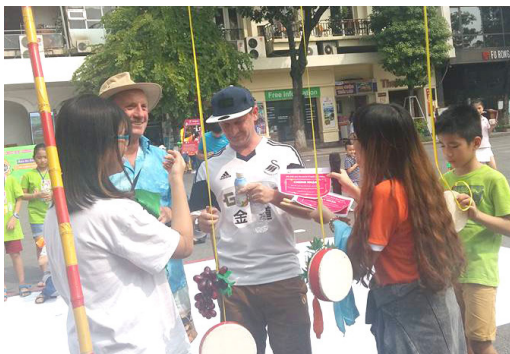
Các bạn nước ngoài đã vượt qua thử thách dinh dưỡng nhé.