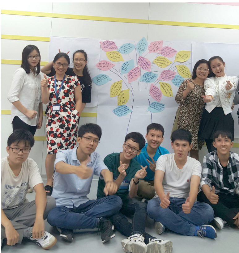
Các bạn trẻ chủ động xây dựng “Cây hành động” và cam kết thực hiện.