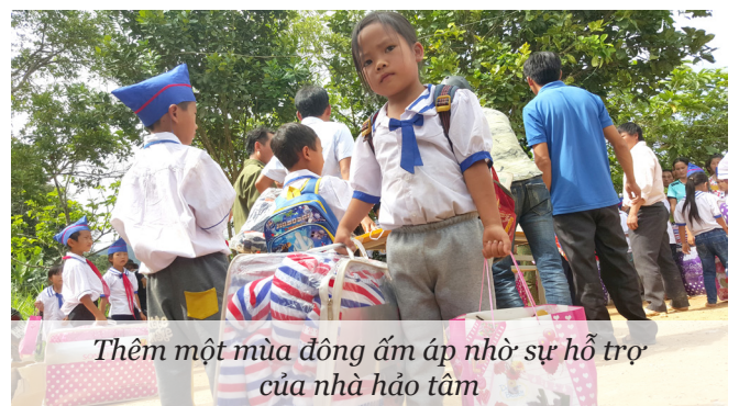
Thêm một mùa đông ấm áp nhờ sự hỗ trợ của nhà hảo tâm